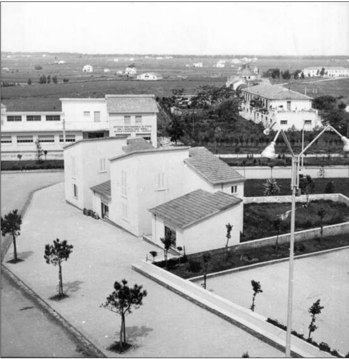
Foto del Borgo di Gromola Completato (1960) Progetto Colombo - Caizzi (1954) Vista dal campanile della chiesa. Si notano l'edificio A - B e la Bufalara sotto un dettaglio della foto ingrandita.