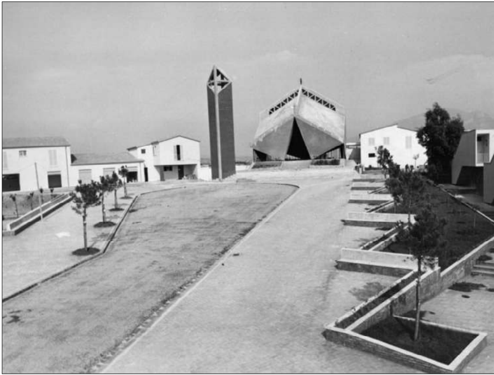
Foto del Borgo di Gromola Completato (1960) Progetto Colombo - Caizzi (1954) Chiesa di Santa Maria Goretti