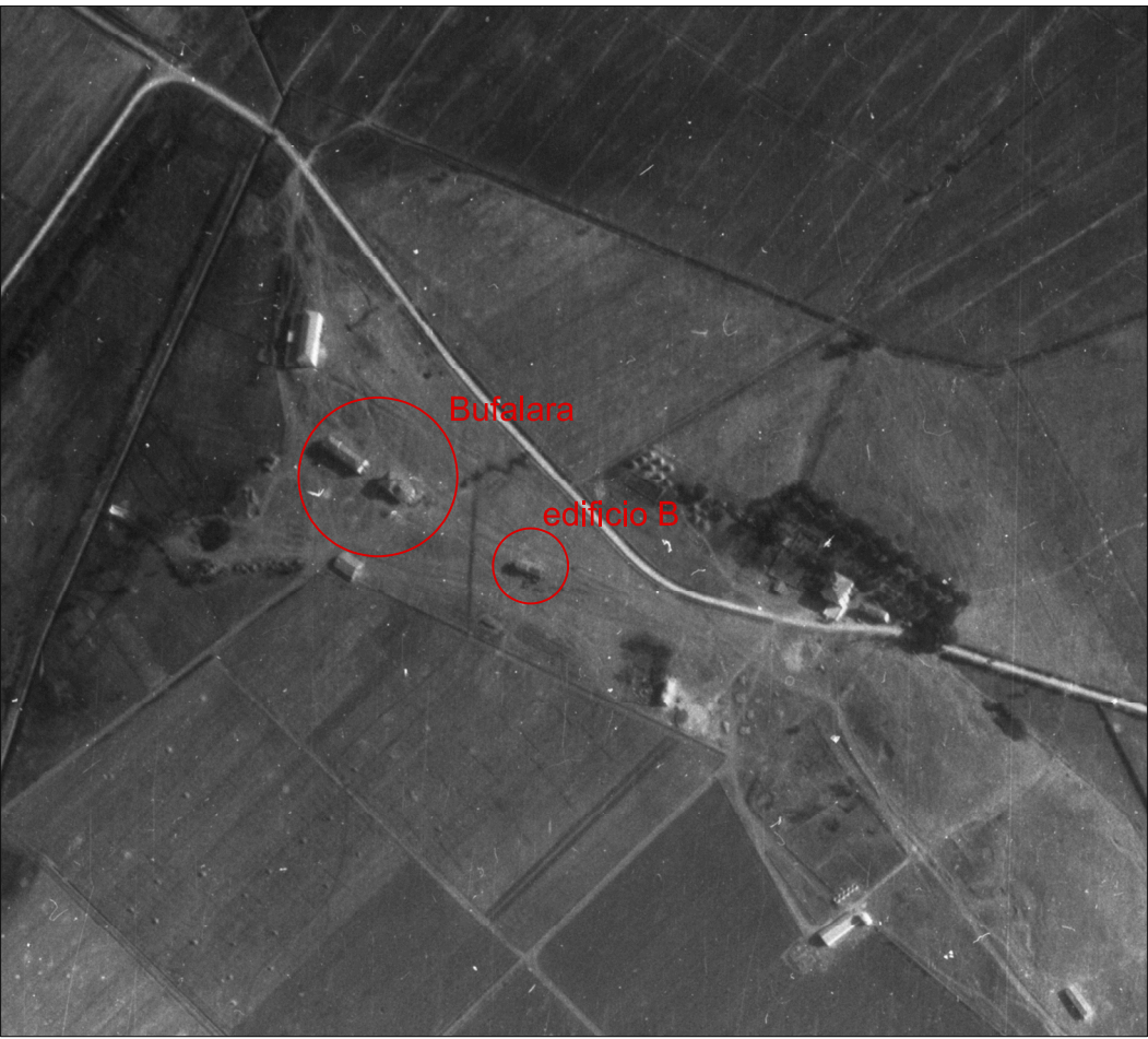
ORTOFOTO I.G.M. 1943 sono evidenziate la Bufalara e l'edificio oggetto di intervento denominato B all'epoca del fabbricato A non vi è traccia. In riferimento al fabbricato B, vista la tipologia costruttiva degli edifici realizzati negli anni precedenti alla Riforma Fondiaria e realtivo alla bonifica della Piana del Sele, è plausibile ritenere che sia stato edificato intorno agli anni '20.